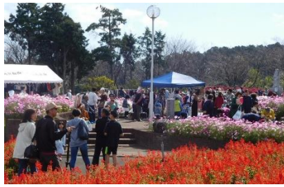
大勢のお客さんで賑わう フリーマーケット会場

今回は3年ぶりの晴天に恵まれ、美しいコスモス満開の有明の森フラワー公園で開催できたため、5千名を超えるお客様が来場しました。