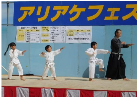
少林派古流空手道・錬心会 による迫力の空手演武

今回も会員の皆様に協賛をお願いしたところ、84事業所より約50万円の協賛をいただきました。この場をお借りしてお礼申し上げます。また、前日から当日にかけてスタッフとしてご協力いただいた皆様には大変お疲れ様でした。