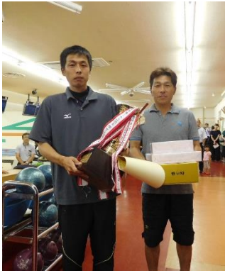
団体の部優勝 川内土建 A チーム

今回は例年に比べて参加チームが少なく盛り上がり心配されましたが、賞品の当たる確率が高まったために大変な盛り上がりとなりました。表彰式では、多くのチームが団体の部と個人の部の両方で賞品を獲得されました。来年も多数のご参加をお待ちしておりますので、よろしくお願ひします。