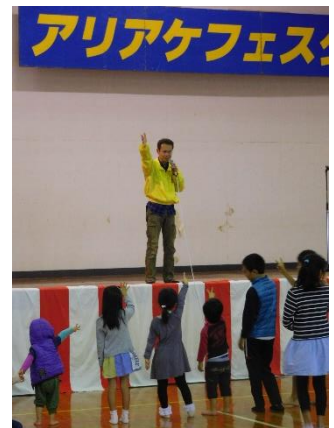
昨年のアリアケフェスタの様子