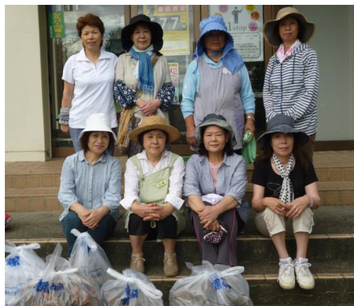
女性部クリーンキャンペーン

7月20日(月)海の日の午前7時から島原市役所有明庁舎及び公民館周辺の清掃活動を行いました。当日は曇天の蒸し暑い中での作業となりましたが、部員8名の参加で周囲は大変綺麗になりました。参加された方は大変お疲れ様でした。