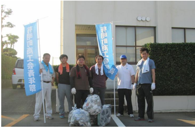
青年部クリーンキャンペーン

悪天候の為順延しておりましたクリーンキャンペーンを8月8日(土)午後4時から広域農道沿いでゴミ拾いを実施しました。当日は猛暑日ながら6名の部員が参加し、空き缶やペットボトルなど多くのゴミを回収。キャンペーン後は大変綺麗になりました。参加された方は大変お疲れ様でした。