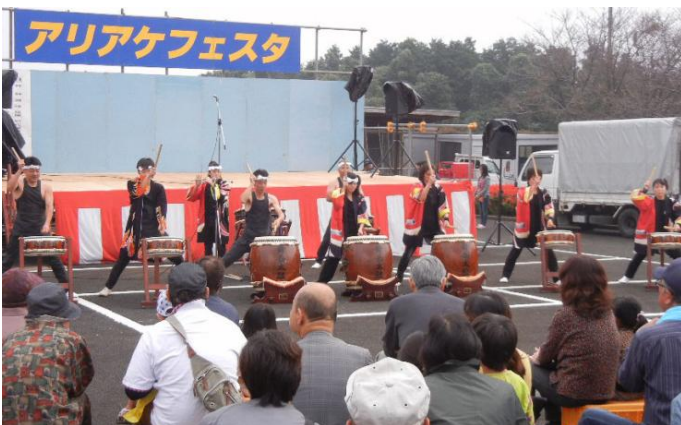
昨年のアリアケフェスタの様子